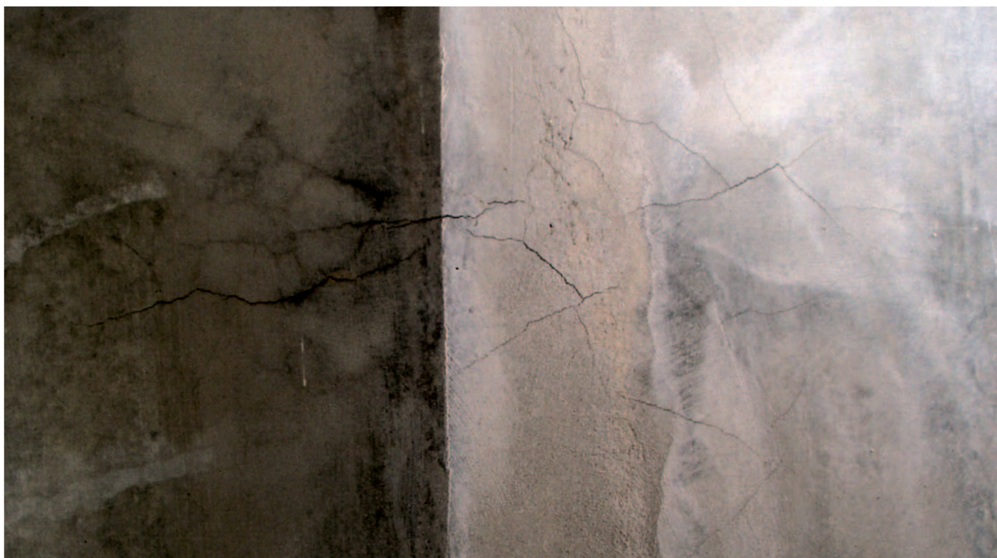
příklad trhlin vhodných k sanaci ETERNAL elastem

Opravy trhlinek na finálním povrchu staveb byly předmětem spolupráce společnosti AUSTIS a.s. a Stavební fakulty ČVUT, při které byla provedena a vyhodnocena řada modelových zkoušek. Z jejich výsledků vplynuly návrhy řešení, které využívají výjimečné vlastnosti nátěrové hmoty ETERNAL elast .