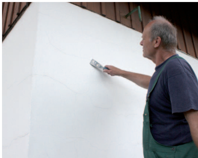
Zbavení podkladu nesoudržných částic.