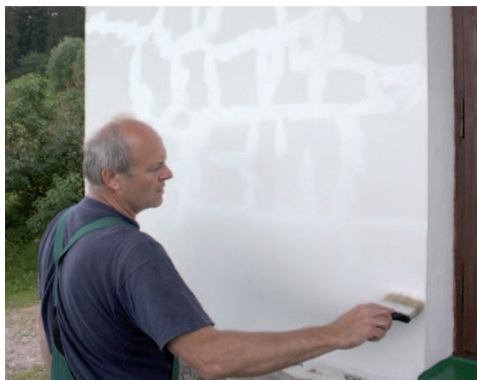
Podetření trhlín hmotou ETERNAL elast .