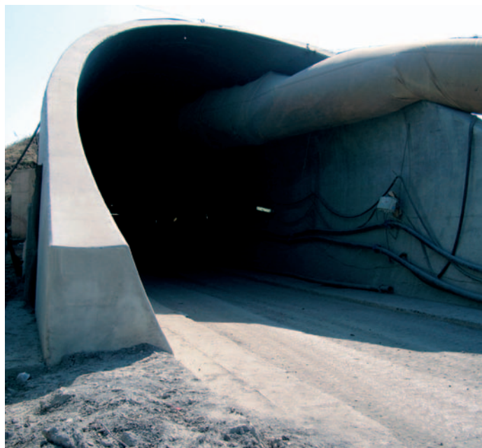
protikarbonatační nátěry v tunelu Březno