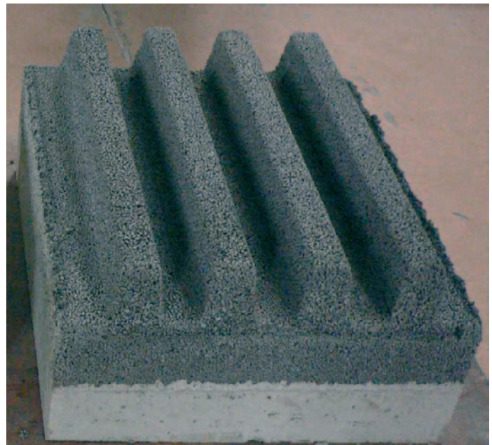
lehčený beton bez nátěru