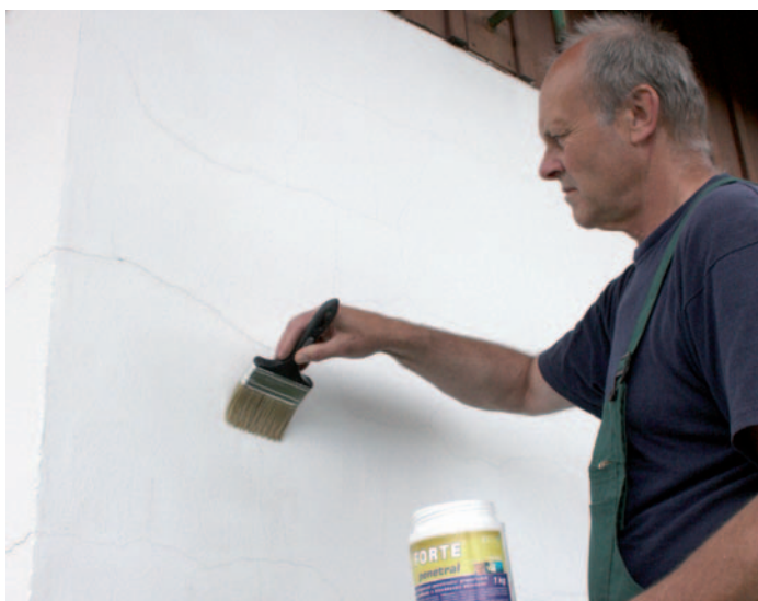
Penetrace trhlinek FORTE penetralem .