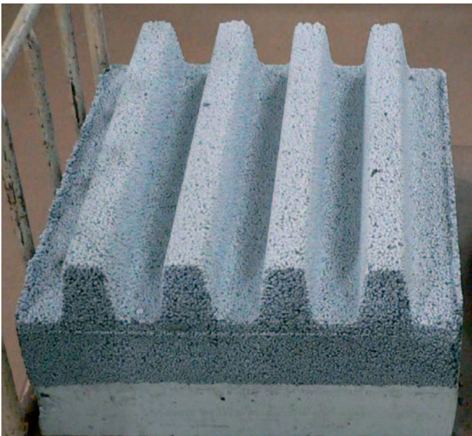
lehčený beton s nátěrem ETERNAL elast