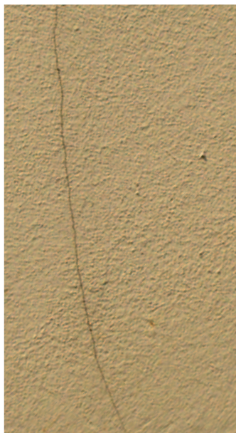
trhlina před sanací

První vrstvu je vhodné provést nátěrovou hmotou ETERNAL elast naředěnou 5 až 10 hm. % vody. Technologická přestávka mezi jednotlivými nátěry je podle klimatických podmínek 6 až 24 hod.