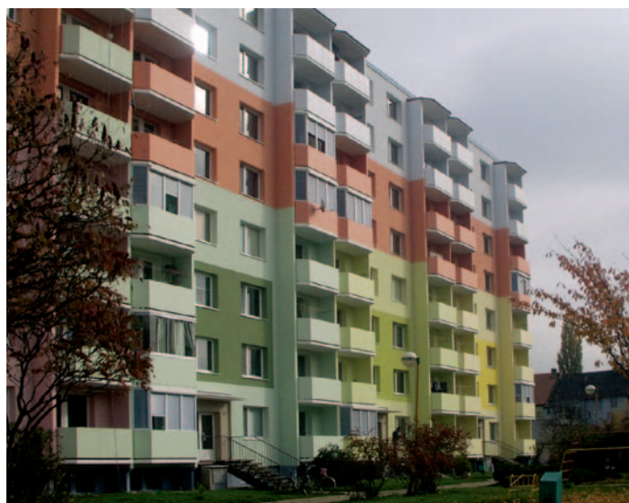
fasáda obytného domu po sanaci trhlin s použitím ETERNAL elastu

Před zahájením sanace povrchových trhlinek je nutné odborné posouzení stavu povrchu s trhlinkami. Konstrukce s povrchovými trhlinkami musí být staticky stabilní, trhlinky musí být v ustáleném stavu. To znamená, že se trhlinky nesmí v průběhu času zvětšovat, ani docházet ke vzniku nových trhlinek. Plochy se sítí trhlinek šířky do 0,3 mm je možné sanovat pouhým nátěrem. Trhlinky šířky mezi 0,3 mm a 3 mm je nutné povrchově zatmelit trvale pružným tmelem, ojedinělé stabilní trhlinky širší než 3 mm do max. 5 mm je nutné sanovat vtačením vymezovacího profilu a přetmelením. Uvedené postupy nelze použít k sanaci statických trhlin konstrukcí, ani k řešení dilatačních spár konstrukcí.