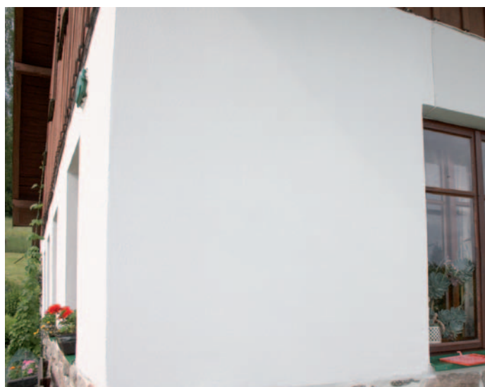
Pohled na stěnu po sanaci.