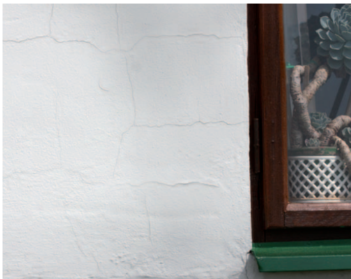
Pohled na stěnu s trhlínkami.

Fotodokumentace postupu sanace trhlinek nátěrem ETERNAL elastem .