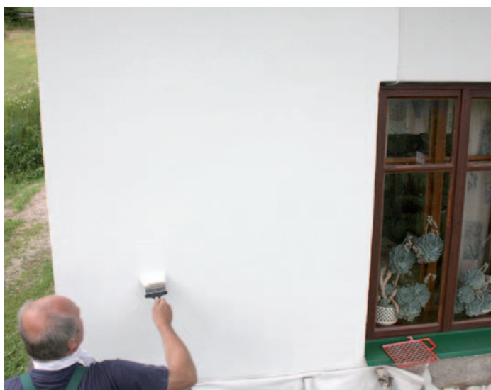
Nátěr hmotou ETERNAL elast .