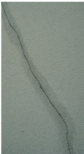
detail trhliny po přetmelení trvale pružným tmelem

Na plochu s trhlinkami provést 3 nátěry nátěrovou hmotou ETERNAL elast se spotřebou 3 x 0,30 kg/m 2 . Tento postup nelze použít pro sanaci statických trhlin konstrukcí, ani pro řešení dilatačních spár konstrukcí.